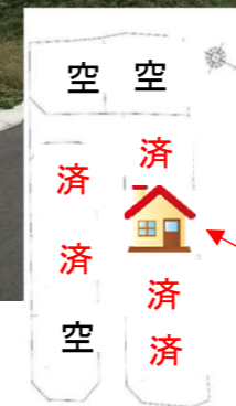
新築建売販売物件

特別価格 2020年にちなんで 土地・建物・本体価格 2,020万円【税込】 外構、カーテン、空調別途